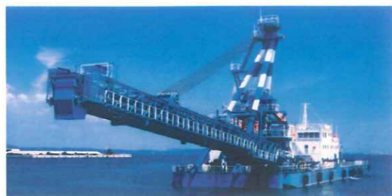
◎バックホウ式揚土船「オーシャン2号」 船体寸法：7.3m×26m×4.3m