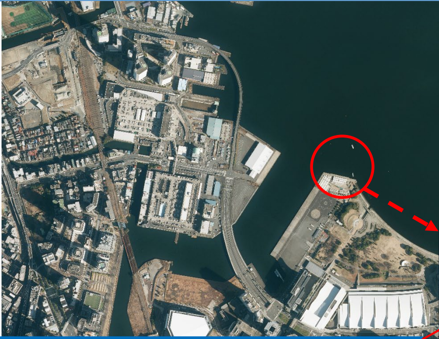
臨港パーク先端護岸整備工事（その5・上部工）