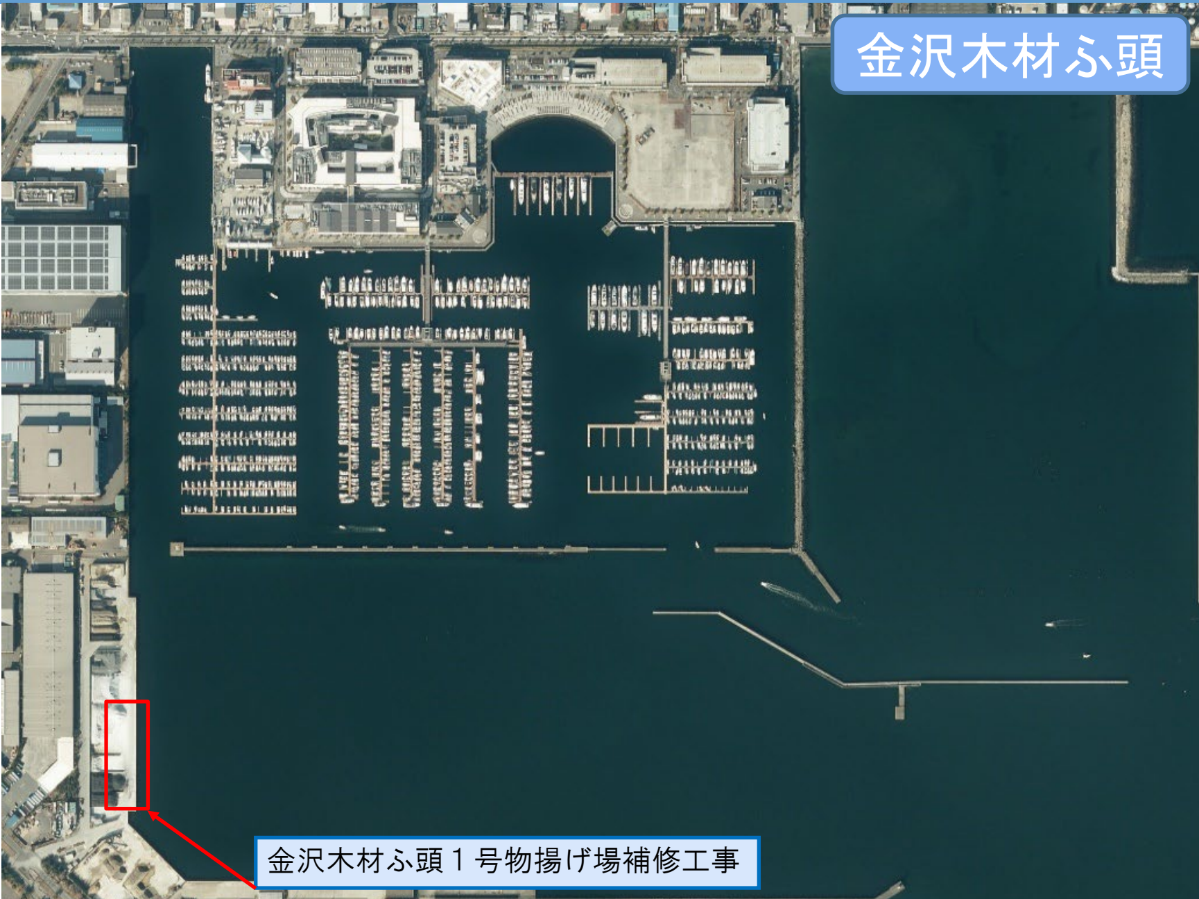
金沢木材ふ頭 1号物揚げ場補修工事